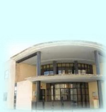
Zona Básica de Biar C. S. Biar C. Aux. Benejama C. Aux. Campo de Mirra C. Aux. La Cañada