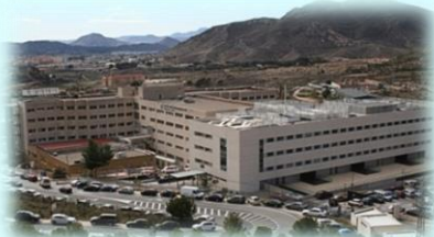
HOSPITAL GENERAL UNIVERSITARIO DE ELDA