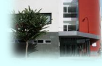
Zona Básica de Sax C. S. Sax C. Aux. Salinas