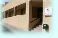
Zona Básica de Petrer C. S. Petrer I C. S. Petrer II