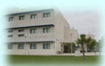
Zona Básica de Novelda C. S. Novelda C. Aux. La Romana