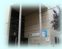
Zona Básica de Villena C. S. Villena I C. S. Villena II C. Aux. La Encina