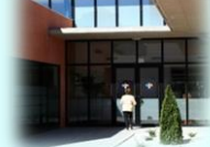
Zona Básica de Pinoso C. S. Pinoso C. Aux. La Algueña