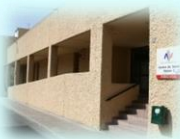
Zona Básica de Petrer C. S. Petrer I C. S. Petrer II