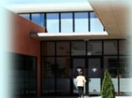
Zona Básica de Pinoso C. S. Pinoso C. Aux. La Algueña