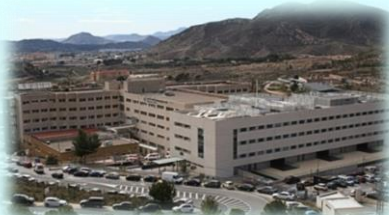
HOSPITAL GENERAL UNIVERSITARIO DE ELDA