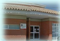
Zona Básica de Monóvar C. S. Monóvar C. Aux. Chinorlet C. Aux. Casas del Señor C. Aux. La Romaneta