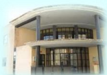
Zona Básica de Biar C. S. Biar C. Aux. Benejama C. Aux. Campo de Mirra C. Aux. La Cañada