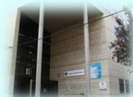
Zona Básica de Villena C. S. Villena I C. S. Villena II C. Aux. La Encina