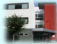
Zona Básica de Sax C. S. Sax C. Aux. Salinas