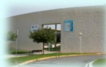
C. S. I. de Villena