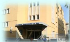
C. E. de Elda