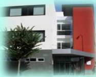
Zona Básica de Sax C. S. Sax C. Aux. Salinas