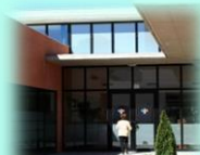
Zona Básica de Pinoso C. S. Pinoso C. Aux. La Algueña