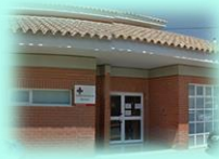
Zona Básica de Monóvar C. S. Monóvar C. Aux. Chinorlet C. Aux. Casas del Señor C. Aux. La Romaneta