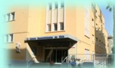
C. E. de Elda