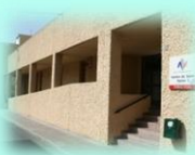
Zona Básica de Petrer C. S. Petrer I C. S. Petrer II