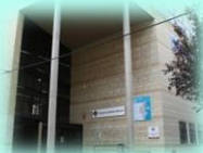
Zona Básica de Villena C. S. Villena I C. S. Villena II C. Aux. La Encina