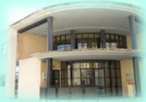
Zona Básica de Biar C. S. Biar C. Aux. Benejama C. Aux. Campo de Mirra C. Aux. La Cañada