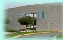
C. S. I. de Villena