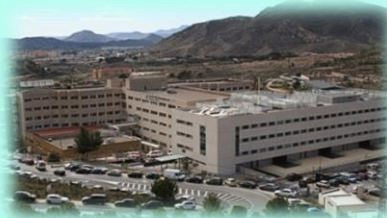
HOSPITAL GENERAL UNIVERSITARIO DE ELDA