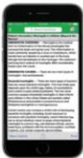
Aplicación de UpToDate para iOS*